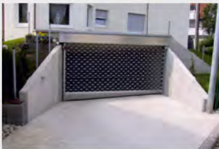
MRTG® als Aussenroller mit Blendkasten und schräger Endschiene