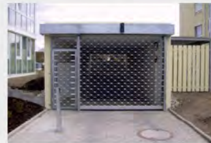
MRTG® als Aussenroller mit Blendkasten und Seitentür (Fluchtweg)