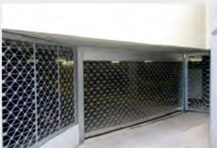
MRTG® mit Sturzblende, ansichtsgleicher Seitentüre und Festelement mit Gitterfüllung