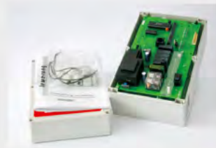
mts2000/02 Multi-Funktions-Steuerung, speziell für Tiefgaragen- tore entwickelt, beinhaltet alle wichtigen Funktionen