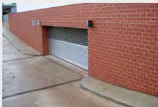
MRTG® mit Marderschutz und schräger Endschiene