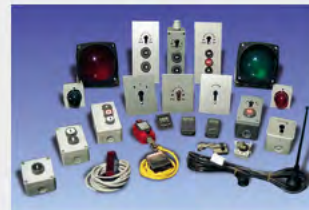
Systemzubehör maximaler Bedienkomfort, durch breites Angebot an modernen Bedienele- menten