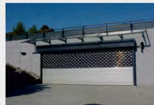
MRTG® als Aussenroller mit Blendkasten und Marder- schutz, Konstruktion nach RAL beschichtet