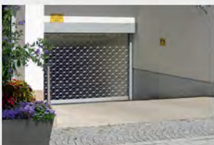
MRTG® als Aussenroller mit Blendkasten, fassadenbündig montiert